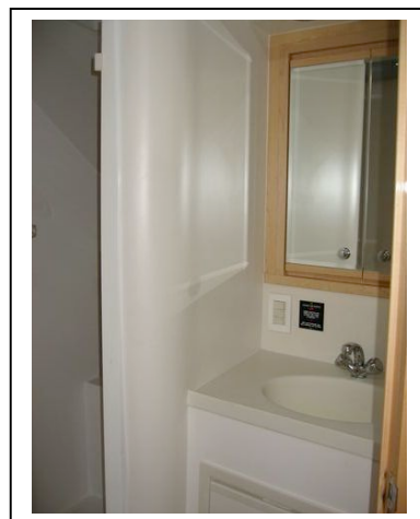
CABINET DE TOILETTE AVEC DOUCHE